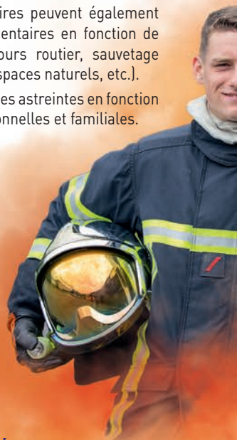
Le secours et soins d'urgence aux personnes