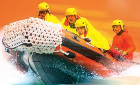
Le sauvetage aquatique