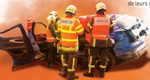
Le secours routier

Ils effectuent des gardes et/ou des astreintes en fonction de leurs disponibilités professionnelles et familiales.